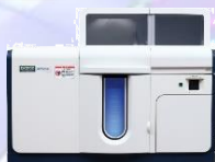
グラファイトファーネス原子吸光光度計 ZA3700