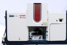
フレーム原子吸光光度計 ZA3300