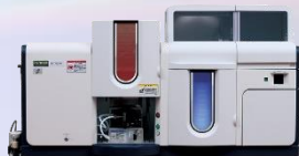
タンデム型原子吸光光度計 ZA3000