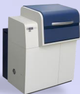
紫外可視近赤外分光光度計 UH4150AD+