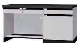
WFJ P. 70