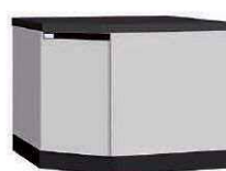
WFM P. 73