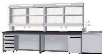
FAK P. 85