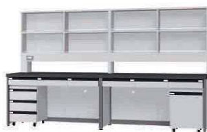
FDE P. 92