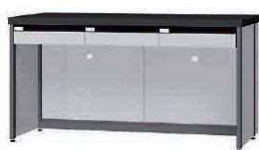
FD P. 86