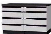
WFB P. 62