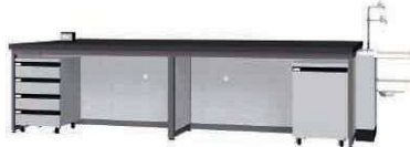
FAB P. 78