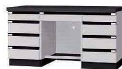
WFI P. 69