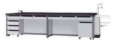
FBB P. 78