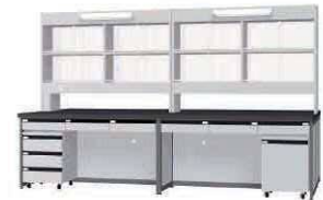
FBF P. 80