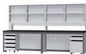
FCE P. 92