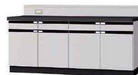
WGG P. 67