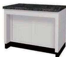
天秤台 MEA P. 93