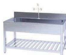
ステンレス流し台 NHA P. 109