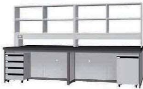
FAD P. 80