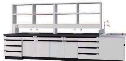
WAQ P. 59