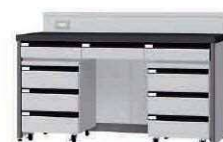
FDF P. 91