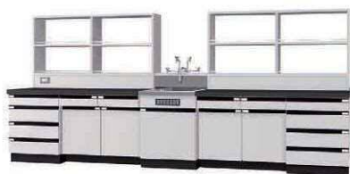
WAP P. 59