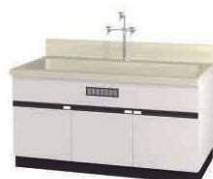
塩ビ流し台 NGA P. 108