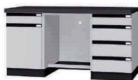
測定台 MCA P. 94