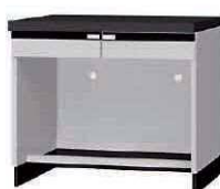
WFL P. 72