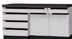
WFD P. 64