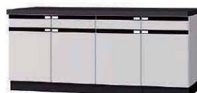
WFG P. 67