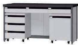
FDB P. 88