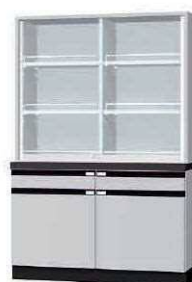
薬品器具戸棚 CEA P. 96