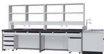
FBJ P. 84