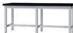
作業台 GEA P. 110