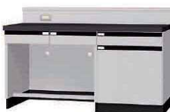
WGJ P. 70