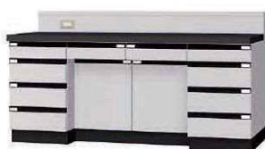
WGF P. 66