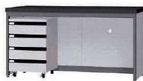
FCA P. 87