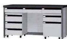
FDD P. 90