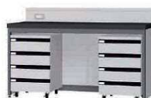
FCF P. 91