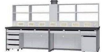
FBH P. 82