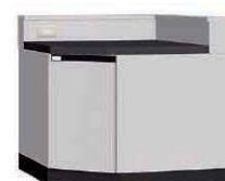
WGM P. 73