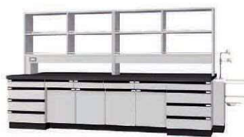
WAK P. 56