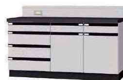
WGC P. 63