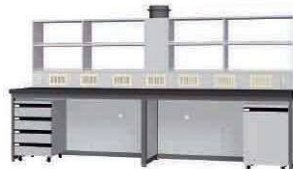
FAH P. 82