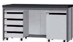
FCB P. 88