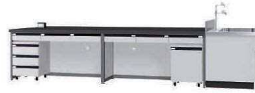
FBC P. 79