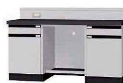
W GK P. 71