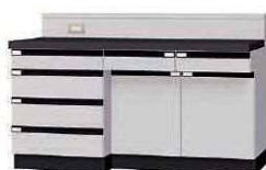
WGD P. 64