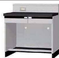
WGL P. 72