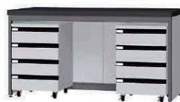
FCC P. 89