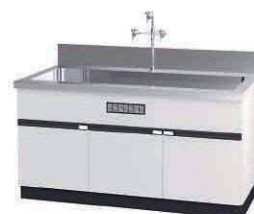
流し台 NCA P. 104