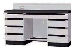
WGI P. 69