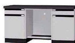
WFK P. 71