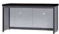
FC P. 86