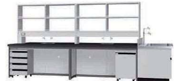
FAJ P. 84