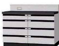
WGB P. 62