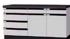
WFC P. 63