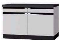
WF P. 60