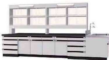
WAM P. 57