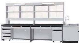
FBG P. 81