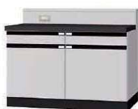
WG P. 60