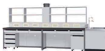
FBI P. 83