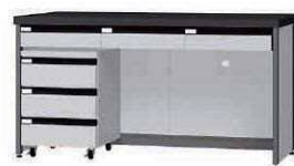
FDA P. 87