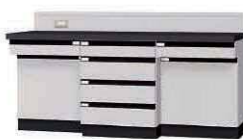
WGH P. 68