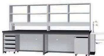
FAE P. 81