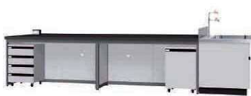
FAC P. 79