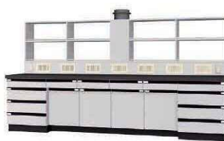
WAN P. 58