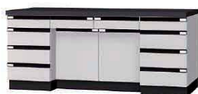
WFF P. 66