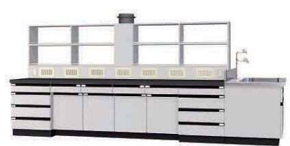
WAO P. 58