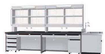
FBK P. 85