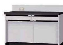
WGA P. 61