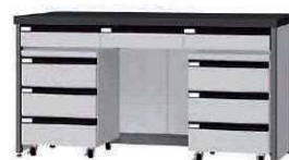
FDC P. 89