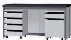
FCD P. 90