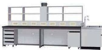
FAI P. 83