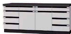
WFE P. 65