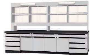
WAL P. 57