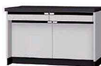
WFA P. 61