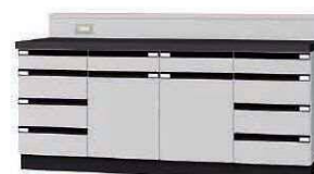
WGE P. 65