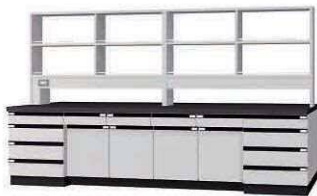
WAJ P. 56