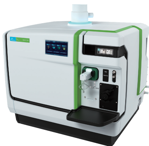
NexION 2200 ICP Mass Spectrometer