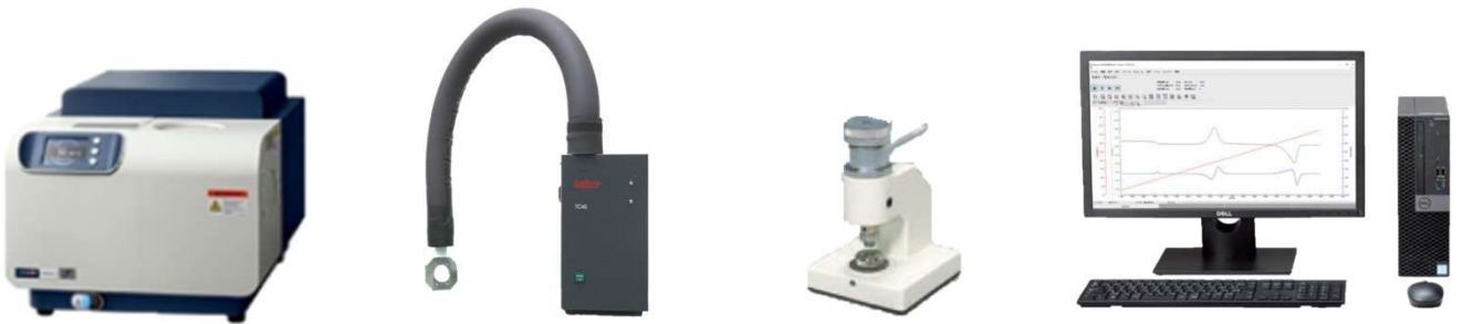
NEXTA DSC200 電気冷却ユニットHU1 サンプルシーラ NEXTAステーションPC