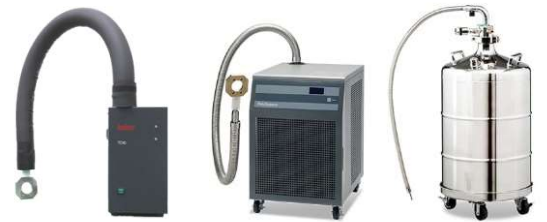
電気冷却 ユニットHU