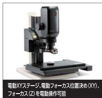
電動XYステージ、電動フォーカス位置決め(XY)、フォーカス(Z)を電動操作可能