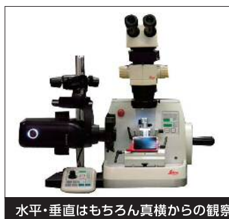
水平・垂直はもちろん真横からの観察も可能